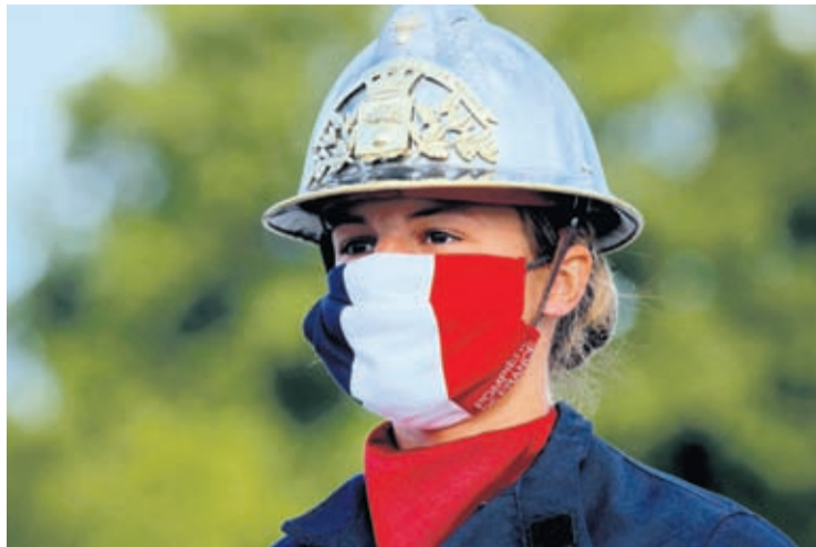
In this July 14, 2020, file photo, a firefighter wears a face mask with the colors of the French flag, prior to the Bastille Day parade on the Champs-Élysées avenue in Paris.

In addition, at least 25 U.S. states are requiring masks in many indoor situations. Oregon on Wednesday even began requiring masks outdoors if people can't stay 6